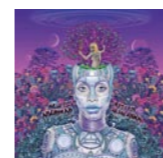
ERYKAH BADU «New Amerykah Part Two (Return of The Ankh)»